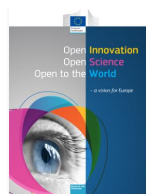
Abb. 1: Publikation „Open Innovation – Open Science – Open to the World“ der Europäischen Kommission

In der aktuellen EU-Politik in den Bereichen Forschung und Innovation ist OA in den größeren Kontext der sog. „3-O-Strategie“ eingebettet, welche die drei Prioritäten des EU-Kommissars für Forschung, Wissenschaft und Innovation Carlos Moedas in eine politische Agenda zusammenfasst: „Open Science, Open Innovation, Open to the World“ (siehe Abb. 1 1 ). Konkret ist OA eines von zahlreichen Handlungsfeldern im Bereich „Open Science“ , das sich auf die Möglichkeiten und Auswirkungen digitaler/webbasierter Technologien in der Forschung bezieht und darauf abzielt, wissenschaftliche Prozesse möglichst offen zugänglich,